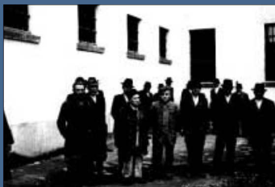
Debreceni kulákok börtönben (1948)

het azonos, amit felülről rákényszerítenek. A kommunista állam pusztító állam, mert identitás nélküli tömegre épül. A lakosság csak is a megfélemlítés és a beletörődésért cserébe kapott viszonylag biztonságos megélhetés miatt viselte el. Ez is a magya-