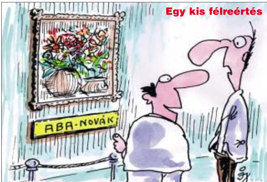
- Miért nem inkább Combinókat fest a volt BKV-vezér?!...

Egy gráfot sokféleképpen le lehet rajzolni a síkban vagy térben, és egy jó módszer megtalálása nemcsak szép képeket ad, hanem nagyon gyakran sokat segít a gráfra vonatkozó algoritmikus kérdések megválaszolásában is. Például tekintsük a gráf éleit gumiszalagoknak, rögzítsük a gráf néhány csúcsát, és hagyjuk, hogy az élek összehúzódnak, amennyire csak tudnak. Ezzel a módszerrel eldönthető, hogy a gráf síkba rajzolható-e, vizsgálható az összefüggősége, és még sok más tulajdonsága.