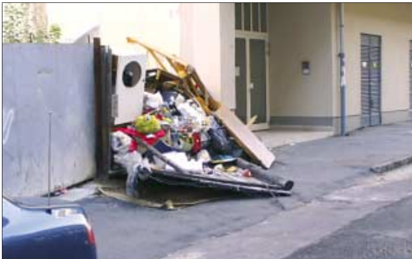
A Dugonics utca 2/B. kerítése nem bírta tovább a mögé ömlesztett szemetet. Azóta az egész kerítés ledől

„Így feddéz az apja!” szól Arany, és verssorai igazságát a környezetemben mérem. Amikor a Józsefváros újság legutóbbi számában megírták sebtemben összegyűjtött emlékeimet, voltak akik tamáskodtak, mondván oly régi dolgokról szólok, hogy ellenőrizni sincs mód, mások meg gratuláltak, azt bizonygatva, hogy az ilyen