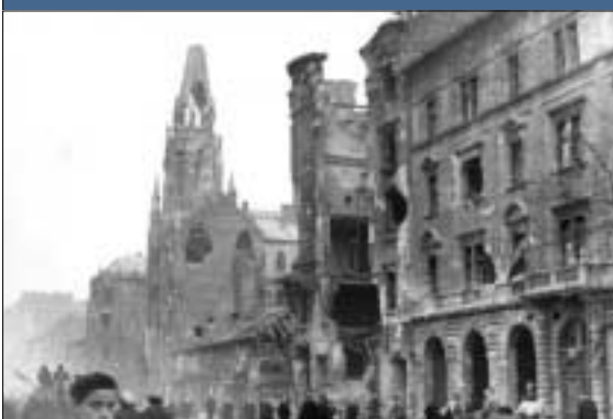
Úllői úti templom a szovjet támadás után (1956)