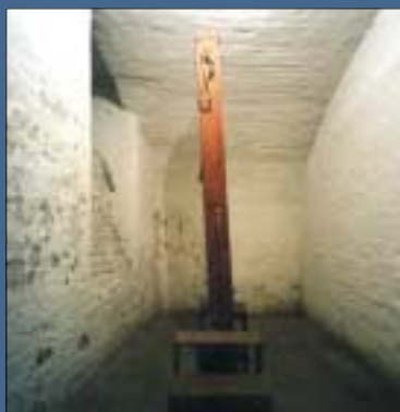
Pincebörtön rekonstrukció a volt ÁVH székházban (Terror háza)