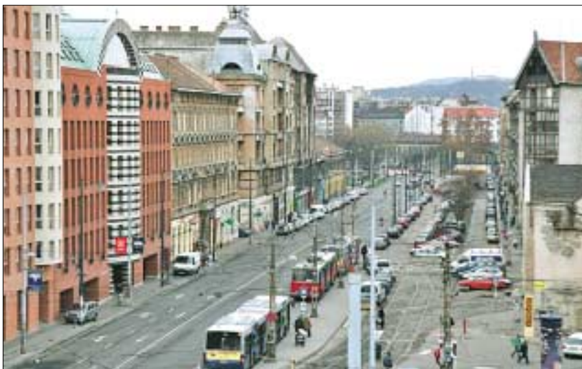
Megújuló házfrontokból új utcakép születik. A hitelek kamatának kétharmadát az állam átvállalja

molyabb hibák keletkeztek az elektromos hálózatban. Árajánlatokat kértünk be a teljes erős-, és gyengeáramú hálózat felújítására. Az árajánlatok azt mutatták, hogy az elvégzendő munka értéke mintegy 14 millió forint. Tudtuk, hogy ezt a nagy összeget csak önerőből és pályázati pénzekből nem lehet finanszírozni, ezért a hitelfelvétel mellett döntöttünk. Természetesen pályáztunk a fővárosi és a józsefvárosi felújítási alapokra is, de társasházunk a fővárosi pályázaton kiesett, mert