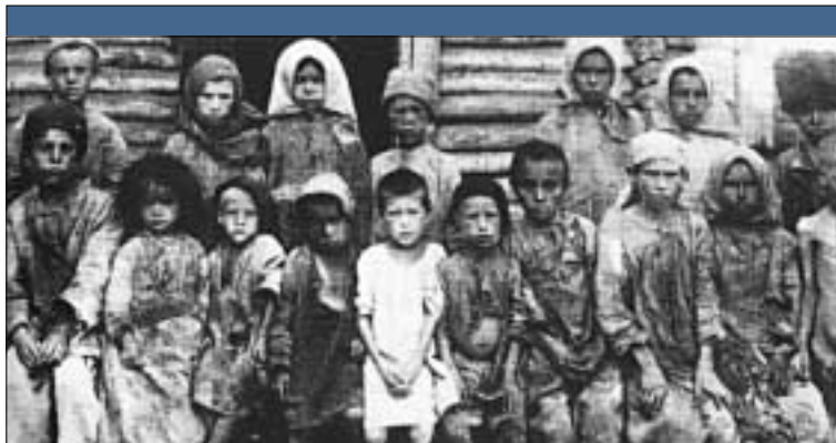
1921-22 Volga-vidék: 5 millió ember éhhalálát okozta a bolshevik parasztpolitika