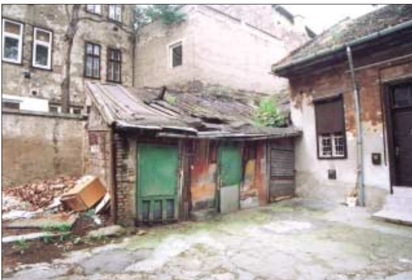
Nemcsak a sufnik, hanem lakóházak alumínium tetőelemeit és esőcsatornáit is rendszeresen ellopják a fémgűjtők

A Karácsony Sándor utcában fogták el a józsefvárosi rendőrök azt a két férfit, akik az egyik lakóház vízelvezető, alumínium csatornáját próbálták meg ellopni. Az elfogott bűnözőket, azóta a bíróság