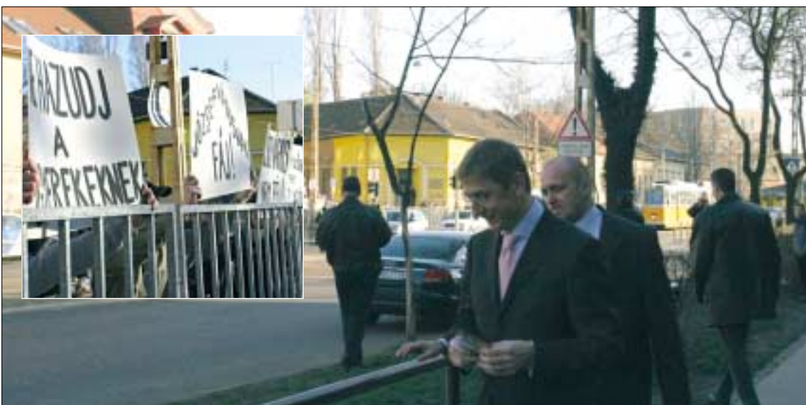
Gyurcsány Ferenc február 14-én a józsefvárosi Deák Diák Általános Iskolában tett látogatást, ahol mintegy száz tüntető fogadta a Nagycsaládosok Országos Egyesületének VIII. kerületi szervezete szervezésében.