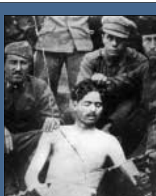
Magyar kommunisták a megkínzott áldozatukkal (1918)