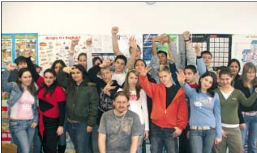
A somogyisok nyelvi csapatában huszonötven tették le egyszerre a Pitman angol nyelvvizsgát

Az igazi meglepetések csak ezután következtek. A Somogyi Béla Utcai Általános Iskolá-