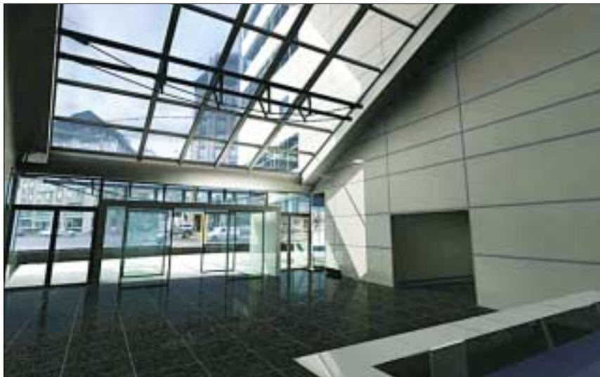
Az üvegfalú irodaház bejáratán át a Kálvin tér forgalmára nyílik kilátás