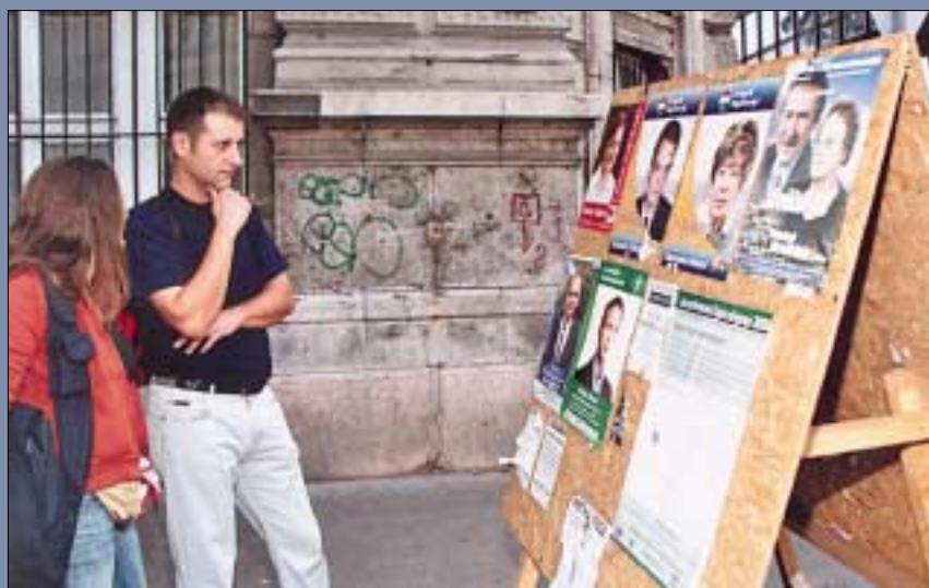
Az országgyűlési választások szinte alig fejeződtek be, máris a helyhatósági választásokra készültek a képviselő-jelöltek