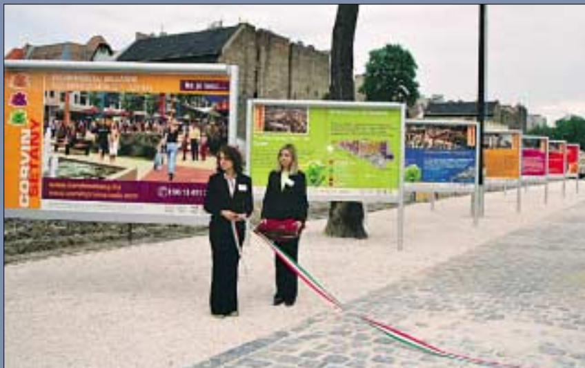
Június elején felavatták az ideiglenes Corvin Sétányt. A Kisfaludy utcát és a Futó utcát összekötő szakaszon végigsétálva megtekinthetők tablók, miként épül majd az új városnegyed