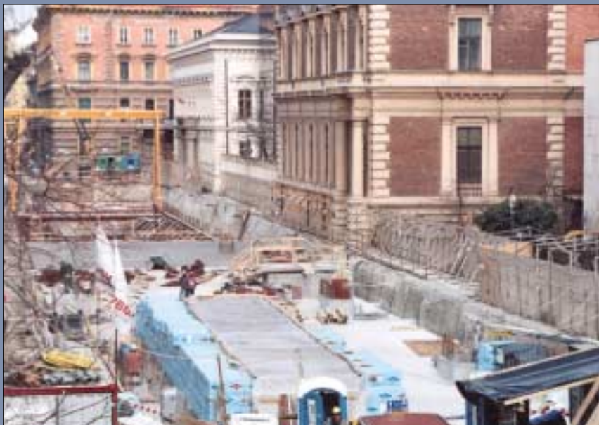
Márciusban a kivitelezők még azt ígérték, hogy júliusra elkészül a Pollack Mihály téren a mélygarázs