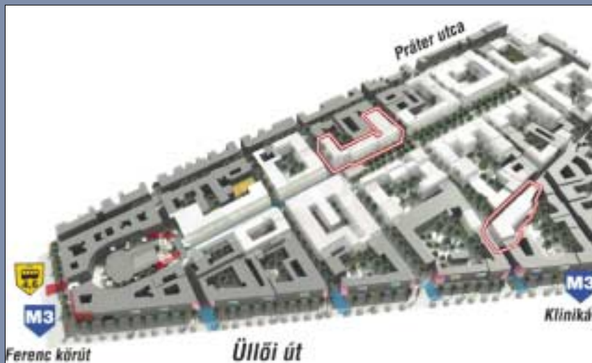
Május elején mutatkozott be a Corvin Sétány Program. A grafikán az elsőként megépülő két új ház elhelyezkedése látható. Az egyik épület alapkövét azóta már letették. Az építkezések elindultak, annak ellenére, hogy a két épület javarésze még csak a tervező asztalon létezik, a vevők szinte minden lakást megvették már