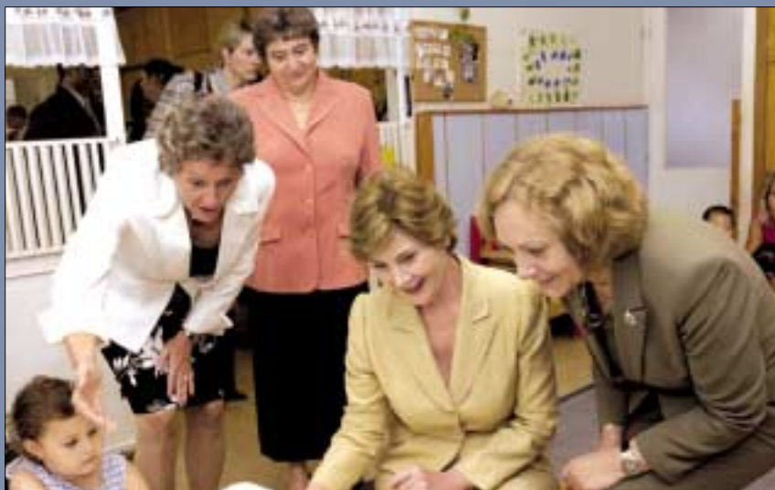
Július elején az amerikai First Lady, Laura Bush és a magyar kormányfő felesége Dobrev Klára ellátogattak a Józsefvárosi Egyesített Bölcsődék központjába. Ide hátrányos helyzetű gyerekek járnak, kiknek szülei is segítséget kapnak életük rendezéséhez, a Biztos Kezdet Program keretein belül. A miniszterelnök felesége szerint ez is hozzá tartozik a magyar kultúrához