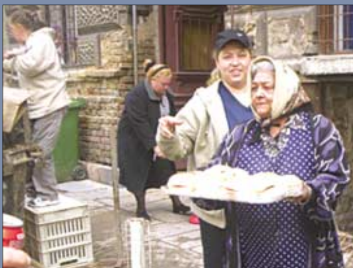
Egy hideg nyári napon a Szigetvári utca 4. lakói elkezdték házuk rendbetételét, amelyhez a Magdolna Program nyújtott segítséget. Elsőként a pince lomtalanításával és kifestésével kezdtek