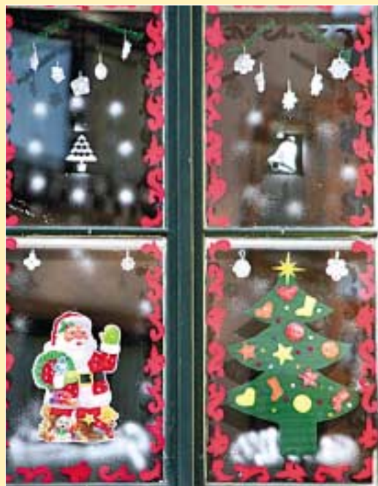
A Nagytemplom utcai bölcsőde az intézmények kategóriájában a megosztott első helyet kapta