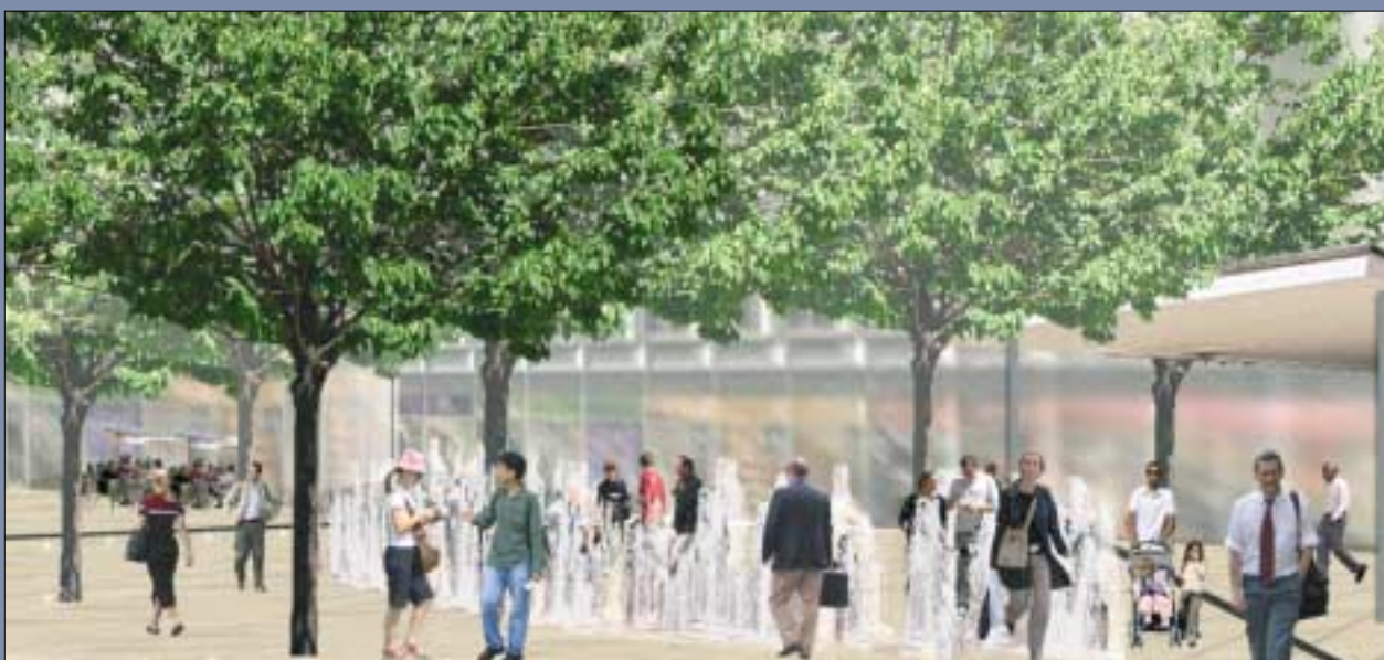
Egy angol tájépítész, Robert Townshend tervei alapján készülnek majd a Corvin Sétány közterei. A koncepciót és a tervrajzokat november végén mutatták be