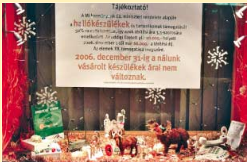
A Kri-Tone Bt. Hallókészülék szaküzletnek jutott a harmadik hely