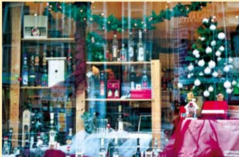
A Szicsek Kft. Pálinka szaküzletének portálja második helyezést ért el

III. helyezett: Kri-Tone Bt. Hallókészülék szaküzlet (József krt. 21.) 40 000 Ft