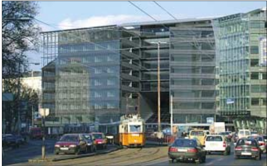
Három évi csend után bérlőkre talált a Kálvin Center irodaház

- Azzal kezdem, hogy a belakatlanság három éve csak súlyosbította az irodaház építése során egymásra rakódott hibákat, hiszen egy alkotás tényleges használat nélkül is amortizálódik. Egy autó is folyamatosan veszít az értékéből, ha nem fut, hiszen nem helyben-állásra tervezték. A tervezők annak idején arra hivatkoztak, hogy az épület helyén egy Ybl