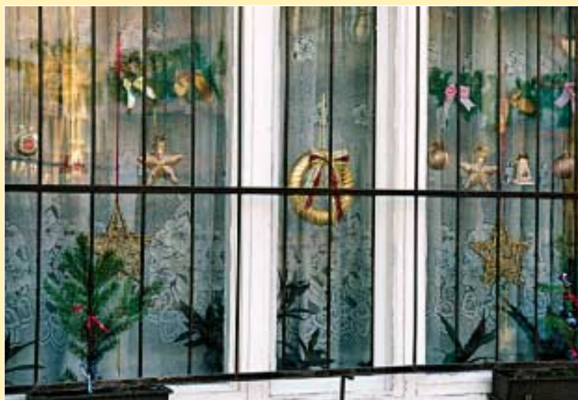
Víg Otthon Idősek Otthona kapta a megosztott első helyezést az Intézmények kategóriában