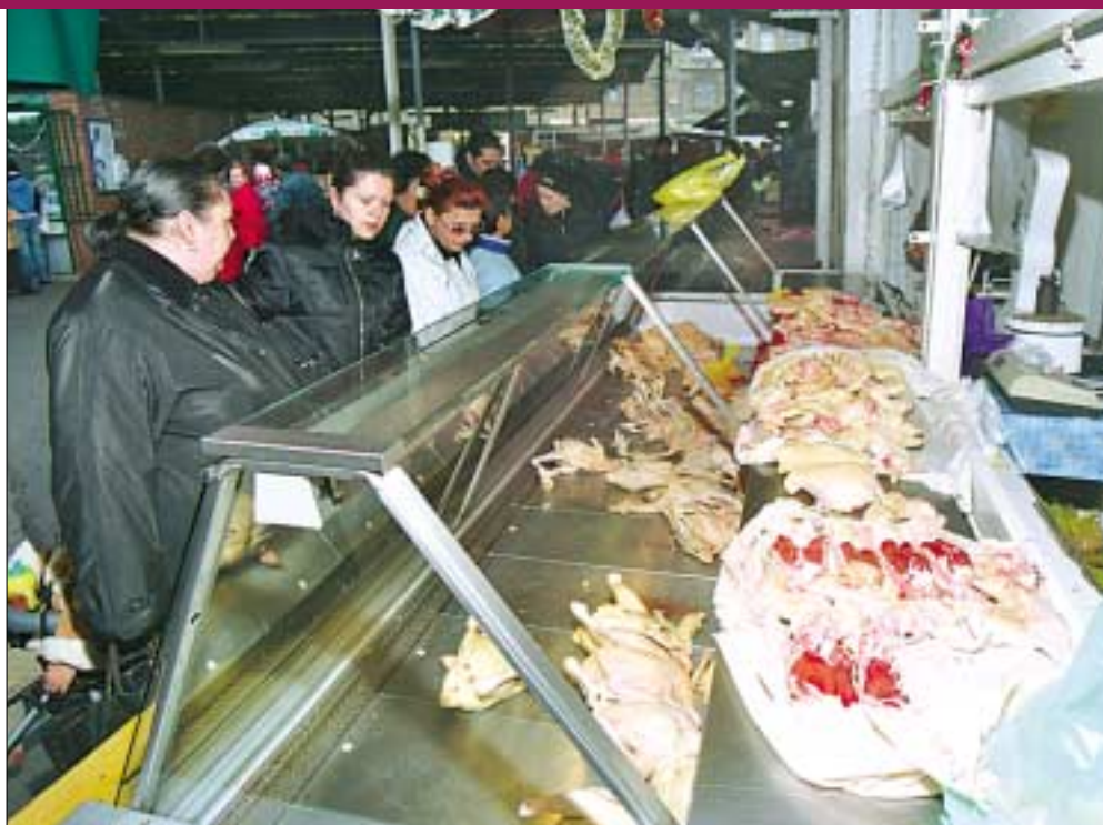
A megélhetőségi költségek növekedésével újból megnőhet a kereslet a csirkefarhát után

A főváros lakossága jelentős közszolgáltatási áremelkedésekkel kezdi az új esztendő. A lakosság tájékoztatási hiányosságok miatt nem tudhatja, hogy a különböző megszorítások bevételnövelő céljait, vagy már az új alapokra helyezett gazdasági reformlépéseket szolgálják. A távhő díja a fővárosban például 37 százalékkal emelkedik. Számítások szerint, egy átlagos, 54 négyzetméteres lakás távhőfűtési díja, a havi 12 ezer forintos átlagárról több, mint 16 ezer forintra emelkedik. Áprilisban további 8 százalékos távhődíj-emeléssel kell számolniuk azoknak, akik távhőfűtéses lakásban élnek. A tömegközlekedés díjtételei is emelkednek, átlagban 13.7 százalékkal. A vonaljegy 230, a havi bérlet 7350 - forintba kerül januártól. A diák és nyugdíjas szelvények ára 2950 forint lett. Magasabb lesz a víz ára, 9.8 százalékkal. A csatorna-használat 9.4 százalékkal lesz magasabb. Számítások szerint egy átlagos budapesti család, két felnőtt, két gyerek eddigi rezsiköltségei mintegy 6-8 ezer forinttal növekednek.