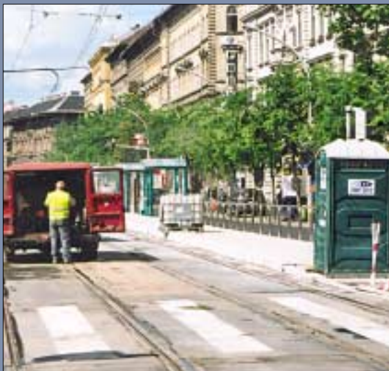
Egész nyáron forgalmi dugókat okozott a 4-es 6-os villamos vonalán a megálló átépítése a Combino villamosok számára