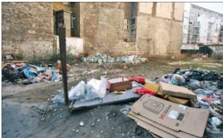
A Dugonics utca 4. szám alatti telken „szelektíven” gyűjtik a szemetet