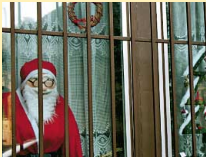
A Reménysugár Idősek Klubjának ablaka kapta a megosztott második helyet az Intézmények kategóriában