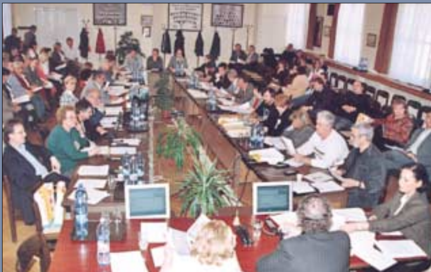
Október 1-jén új képviselő-testületet választottunk. A voksolás a jobboldal elsőprő győelmével zárult. A polgármester személye változatlan maradt. Az új testület már október 6-án megkezdte munkáját. Visszahozták a régi-új ülésrendet is