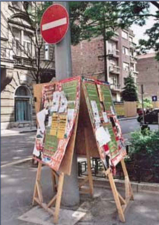
Már a választási kampány kezdetéről számoltunk be február 20-i számunkban. Emellett arról is hírt adtunk, hogy a mobil plakáthelyek kihelyezése késik, március elejére azonban kikerültek a posztamensek

Az elmúlt esztendőben számos fontos, érdekes és hasznos esemény történt a kerület életében. Ezeket próbáltuk meg összegyűjteni képekben. Beszámolónk, mint a válogatások tulajdonságához illik, nem teljes. Olyan történetekre is visszaemlékezünk, amelyek nem a kerületben élők mindennapjaira voltak hatással, ám érdekesek voltak. Ilyen például a 105 éves néni születésnapjának köszöntése. Országos eseményeket is megemlégtünk, ilyenek voltak a választások.