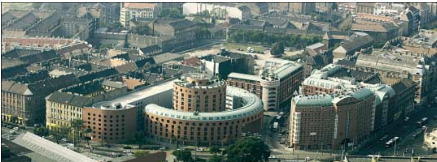
A vörösklinkerrel borított Orczy Fórum Józsefváros névjegye lehet