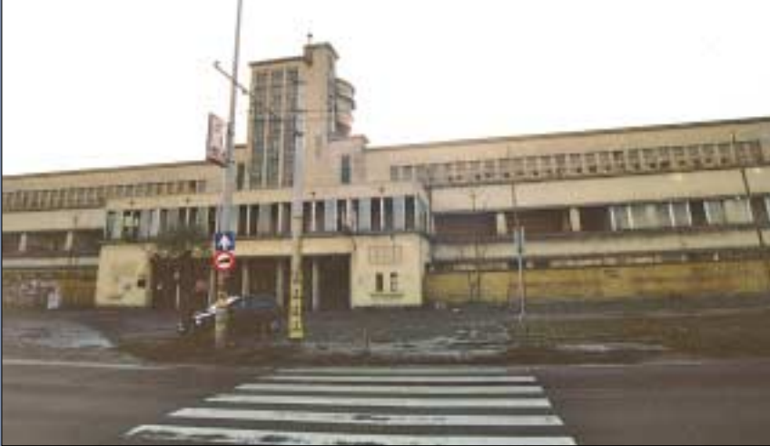
Eldőlt a Lovi, vagyis az Ügető sorsa. A korábbi francia tulajdonostól megvásárolta a Plaza Centers

Az elmúlt esztendőben számos fontos, érdekes és hasznos esemény történt a kerület életében. Ezeket próbáltuk meg összegyűjteni képekben. Beszámolónk, mint a válogatások tulajdonságához illik, nem teljes. Olyan történetekre is visszaemlékezünk, amelyek nem a kerületben élők mindennapjaira voltak hatással, ám érdekesek voltak. Ilyen például a 105 éves néni születésnapjának köszöntése. Országos eseményeket is megemlégtünk, ilyenek voltak a választások.