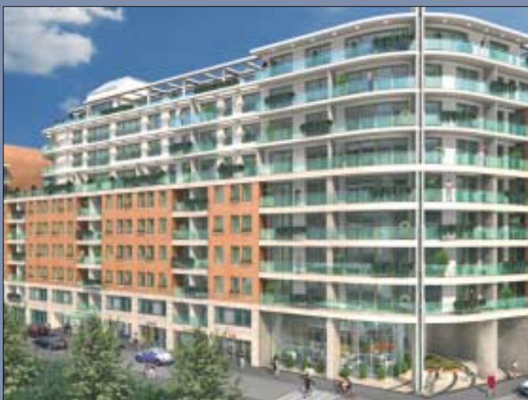
Szeptemberben letették a Corvin Sétány Program első épületének alapkövét. A Premier Ház összes lakása rövid időn belül elkelt