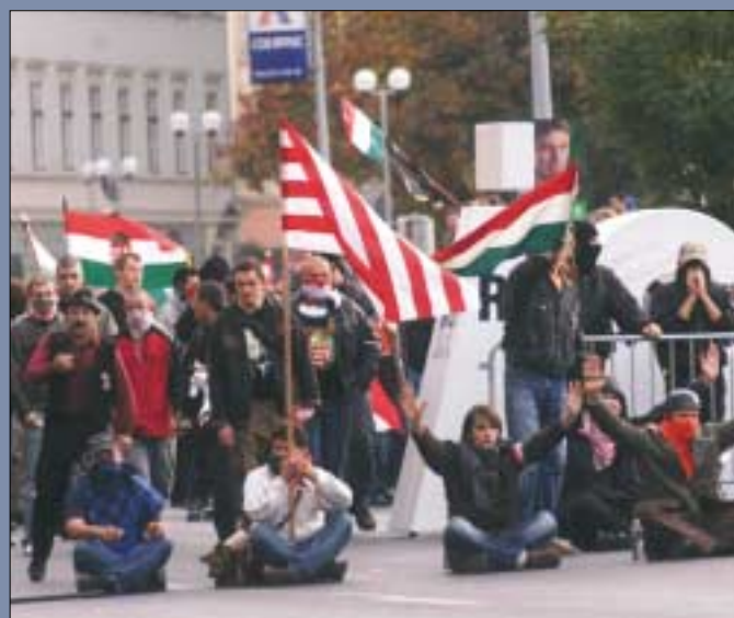
Az '56-os forradalom jubileumának ünneplése az általános elégedettség miatt utcai tüntetésekbe torkollott. Józsefvárosban több helyen is tüntetők gyülekeztek