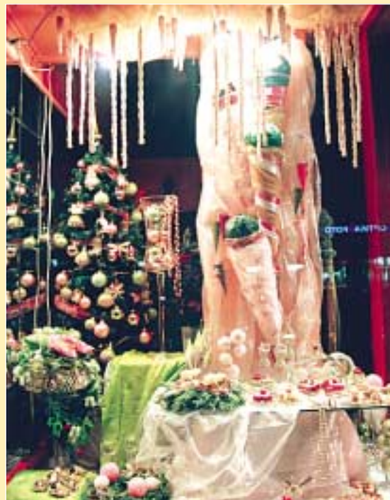
Első helyezést ért el a Kereskedők - vállalkozók kategóriában a Flóra Stúdió Bt. virág üzletének kirakata