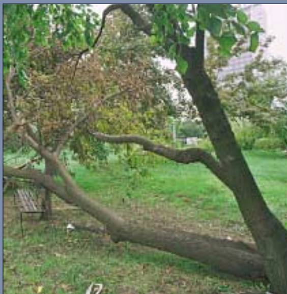
Az augusztus 20-i nemzeti ünnep tragédiába torkollott. Az orkán az Orczy-kertre is lecsapott. A helyi Katasztrófavédelem több helyen mentette az embereket. A csatatér látványa még sokáig emlékeztetett a drámai estére