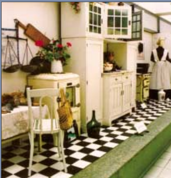
2006-ban ünnepelte a Fővárosi Gázművek Rt. 150 éves évfordulóját. A működését 1856-ban Józsefvárosban kezdte meg a Köztársaság téren