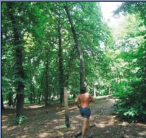
Együttműködési megállapodást kötött az Orczy-kert vezetése több intézménnyel, akik szakmai irányítással járulnak hozzá a kert megújításához, gondozásához