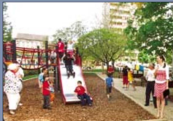
Májusban elkészült a Losonci téren a kerület legkorszerűbb, európai normák szerint épült játszótere