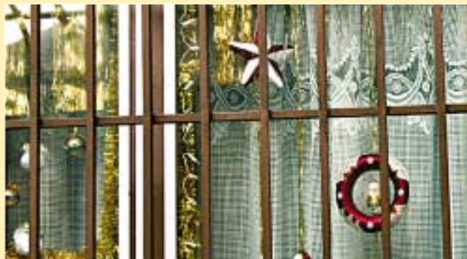
Az Őszikék Idősek Klubja az Intézmények kategória másik második helyezettje

II - II. helyezettek: Reménysugár Idősek Klubja (Mátyás tér 4.) 35 000 Ft, Őszikék Idősek Klubja (Baross u. 109.) 35 000 Ft