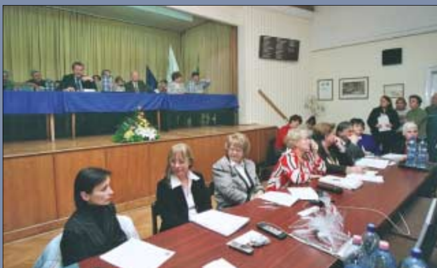
December 14-én az önkormányzat közmeghallgatást tartott, amelyen minden józsefvárosi lakos feltehetette közérdekű kérdését

Új helyre költözött novemberben a Golden Tiger's Kung-fu School. Ezentúl a Röck Szilárd utca 15-ben várják a sportolni vágyókat