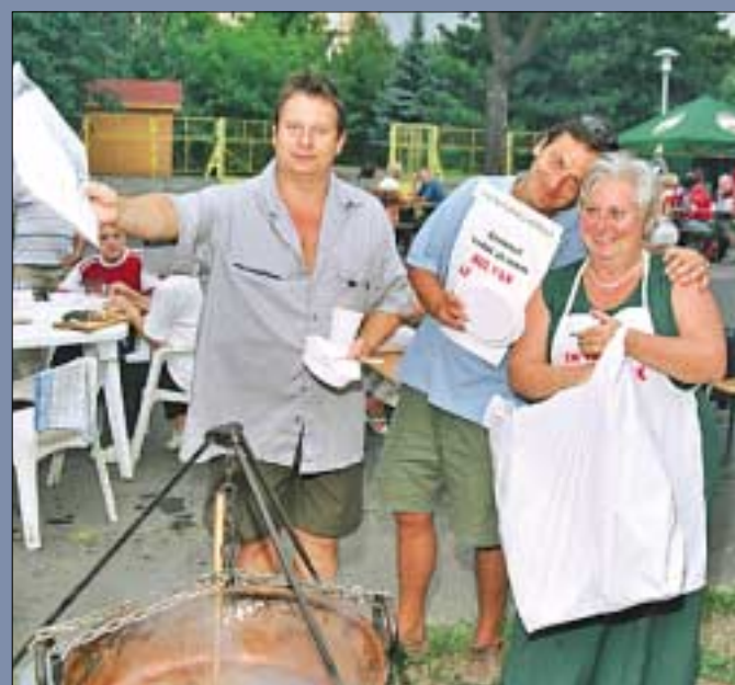
A 120. évfordulóját ünnepelte 2006 nyarán a Tisztviselőtelep