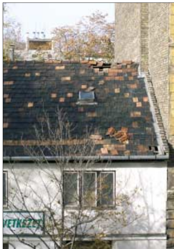
A megrongálódott tetőről folyamatosan hullanak az utcára és az ott elhaladó járókelőkre a cserepek

A mellékelt fényképen kívánom bemutatni a Mátyás tér 15-ös ház tetejének állapotát, amelyet még az augusztus 20-i vihar rongált meg. Próbáltam bejelentési lehetőséget találni a Józsefváros honlapján, de nem találtam, így talán, ha Önök