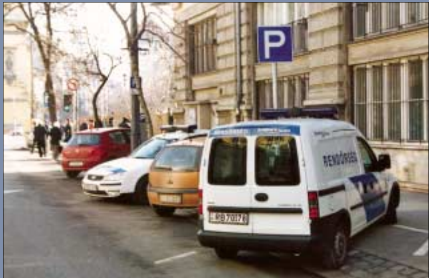
Bombariadó miatt ürítették ki a polgármesteri hivatalt február 22-én. Robbanó-szerkezetet azonban a szakemberek nem találtak