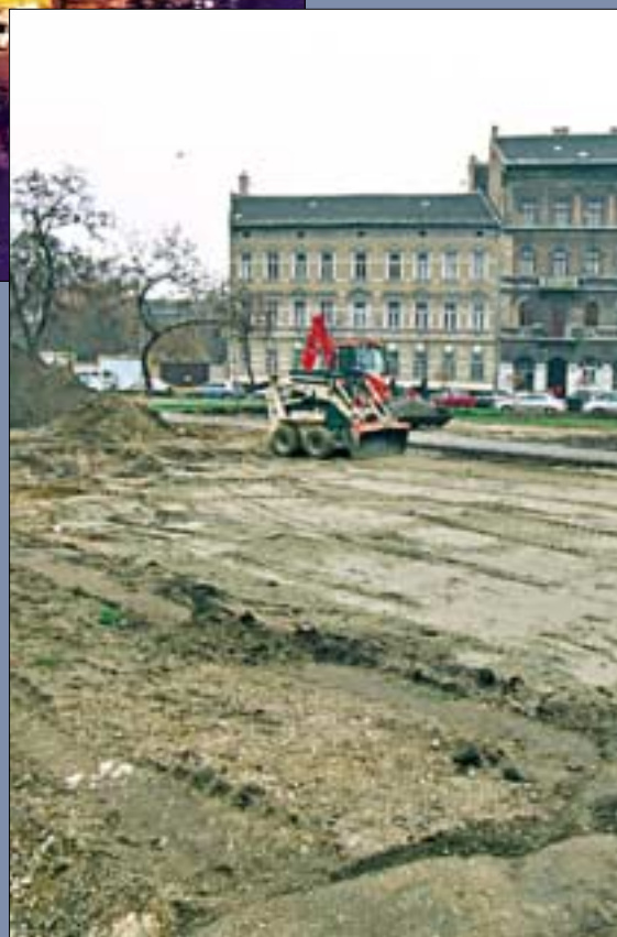
Decemberben elkezdődött a Mátyás tér átépítése. A szakemberek december végére ígérték a munkálatok befejezését, de azok még a mai napig is tartanak