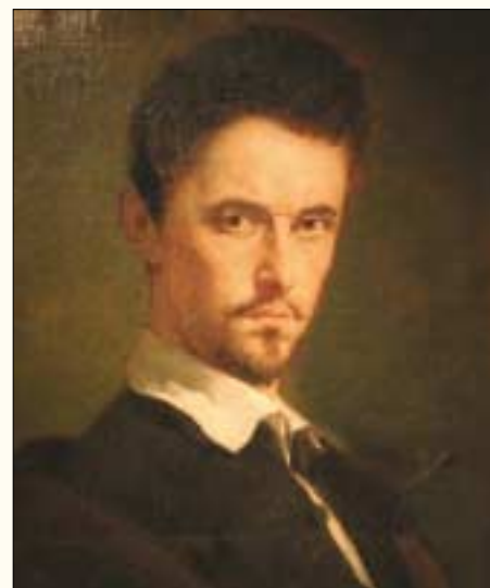
Petőfi Sándor mellképe (Benczúr Gyula festménye, Petőfi Irodalmi Múzeum)

Landerer nyomdája legközelebb volt hozzánk, oda mentünk. Jókait, Vasvárit, Vidácsot és engem neveztek ki küldötteknek, hogy a sajtót lefoglaljuk. Mi megtettük azt a nép nevében és a tizenkét pont és a nemzeti dalt rögtön nyomni kezdték. /.../ Dél felé elkészültek a nyomtatványok s ezrenként osztottak szét a nép között, mely azokat részeg örömmel kapkodta. /.../ A szakadó eső dacára mintegy 10.000 ember gyűlt a múzeum elé, honnan közhatározat szerint a városházához mentünk, hogy a tizenkét pontot magokénak vallják a polgárok is és velünk egyesüljenek. Egy-