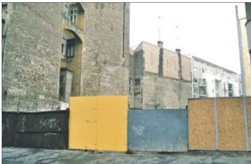
Az illetékesek szerint a Dugonics utca 2. számú ház kerítéséről decemberi fotót közöltünk. Ott lakó olvasóink szerint a helyrehozott kerítés egy hetes

Kicsit sajnálom, hogy nincs kirakva látványterv egy nagy táblára, mint a környékbeli építkezéseken. Ha esetleg van valami képünk a park tervezett állapotáról, megtennék, hogy