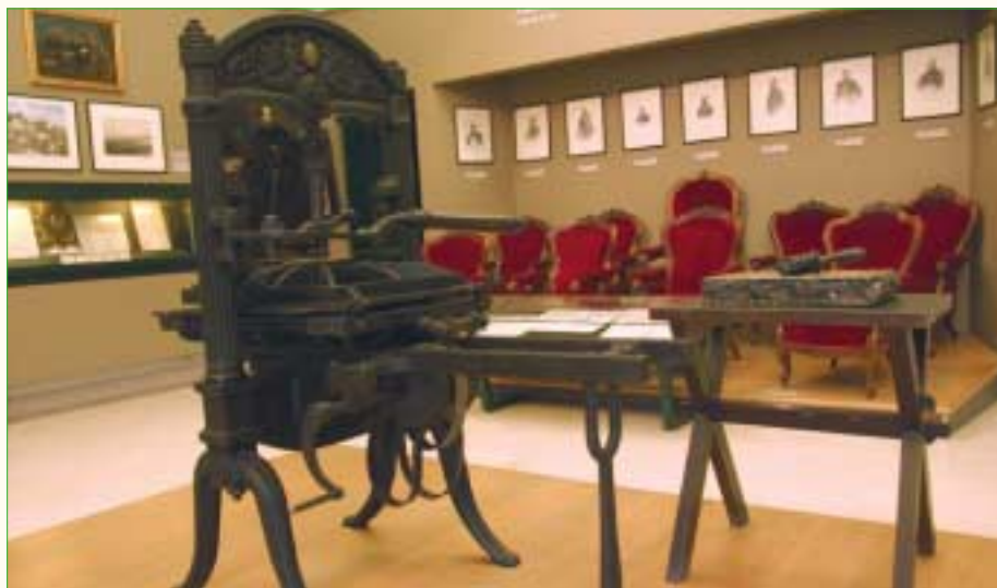
1848 márciusában használt nyomdagép, Landerer és Heckenast nyomdájából