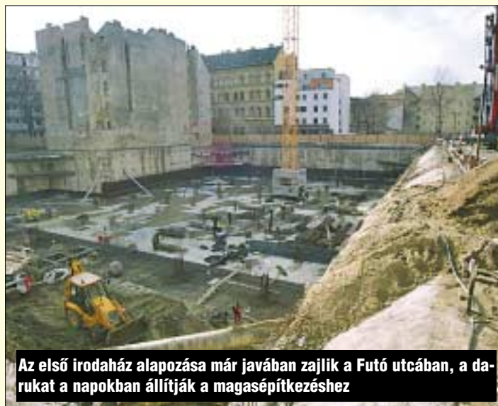
Az első irodaház alapozása már javában zajlik a Futó utcában, a darukat a napokban állítják a magasépítkezéshez