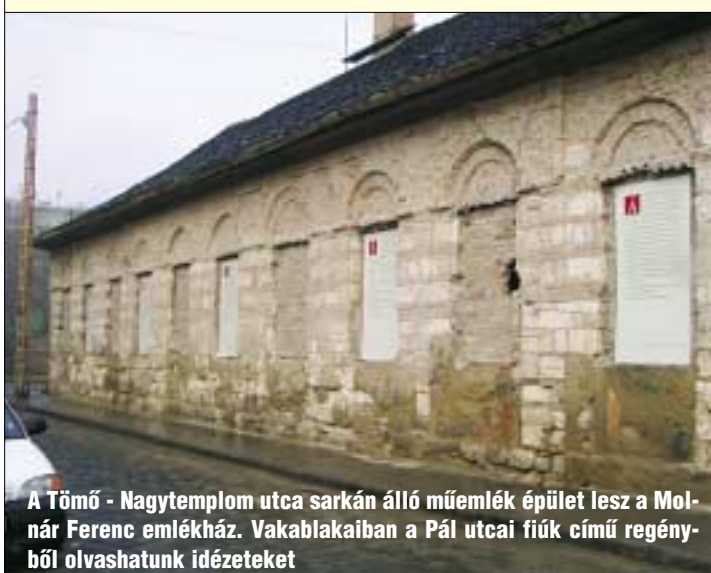
A Tömő - Nagytemplom utca sarkán álló műemlék épület lesz a Molnár Ferenc emlékház. Vakablakaiban a Pál utcai fiúk című regényből olvashatunk idézeteket