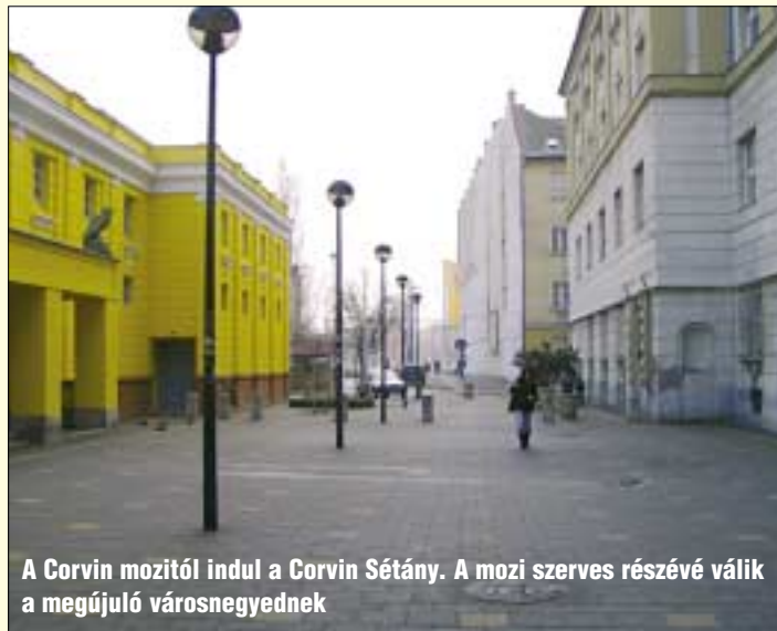
A Corvin mozitól indul a Corvin Sétány. A mozi szerves részévé válik a megújuló városnegyednek