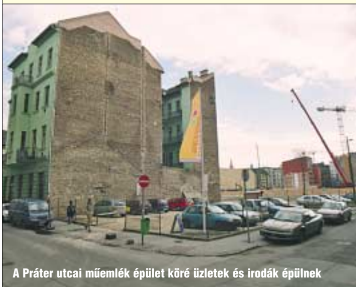
A Práter utcai műemlék épület köré üzletek és irodák épülnek