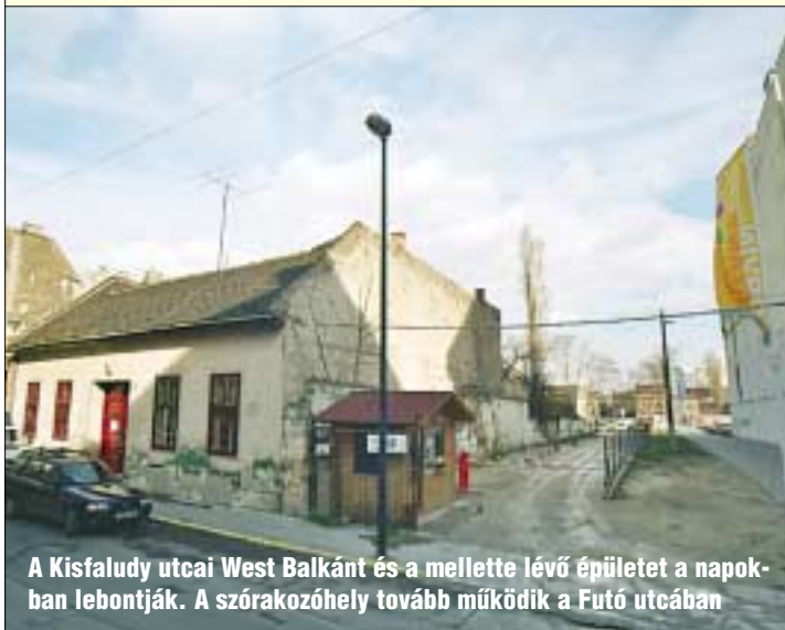
A Kísfaludy utcai West Balkánt és a mellette lévő épületet a napokban lebontják. A szórakozóhely tovább működik a Futó utcában

A Corvin sétányon elkezdődtek az építési munkálatok. Bár a bontások továbbra is folytatódnak, már egy irodaház és egy lakóépület alapjait elkezdték építeni. Körbesétáltunk a területen, amelynek állapotáról fotókban adunk tájékoztatást.