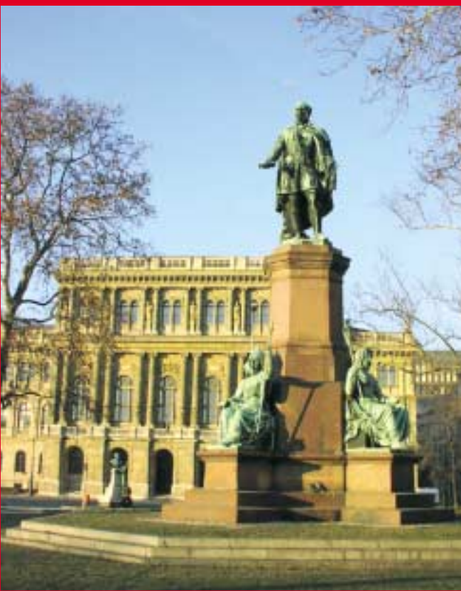
Gróf Széchenyi István szobra a Magyar Tudományos Akadémia előtt

1832-ben Kossuth megjelentette az Országgyűlési Tudósítások című lapot, amelyből értesülhetett az ország népe a tanácsstermekben folyó vitákról. Az egyre erősödő reformmozgalmat az uralkodó - ekkor már V. Ferdinánd - és környezete nem nézte jó szemmel, ezért sok magyar vezetőt bebörtönzött. A folyamatot azonban nem tudta megakadályozni. 1847 nyarán megalakult az ellenzéki Párt, aminek elnöke gróf Batthyány Lajos lett. Programjukat az ellenzéki nyilatkozatot, Deák Ferenc fogalmazta meg. Követelték a Parlamentnek felelős magyar kormány létrehozását, a sajtószabadságot, az egyesületi és gyülekezési szabadságot, Erdély Magyarországhoz csatolását, a közteherviselés bevezetését, a törvény előtti egyenlőség bevezetését valamint, hogy a nép is képviseltesse magát a törvényhozásban és a helyhatósági választásokon. Az Ellenzéki Nyilatkozat a márciusi forradalom programjává vált.