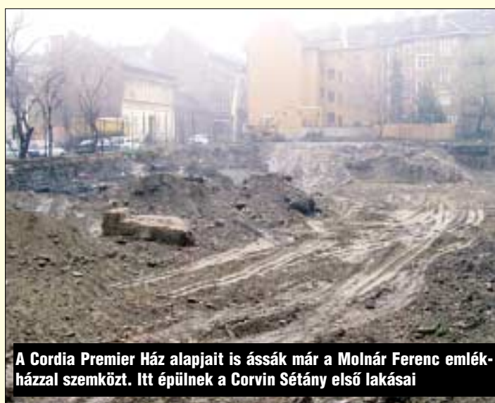
A Cordia Premier Ház alapjait is ássák már a Molnár Ferenc emlékházzal szemközt. Itt épülnek a Corvin Sétány első lakásai