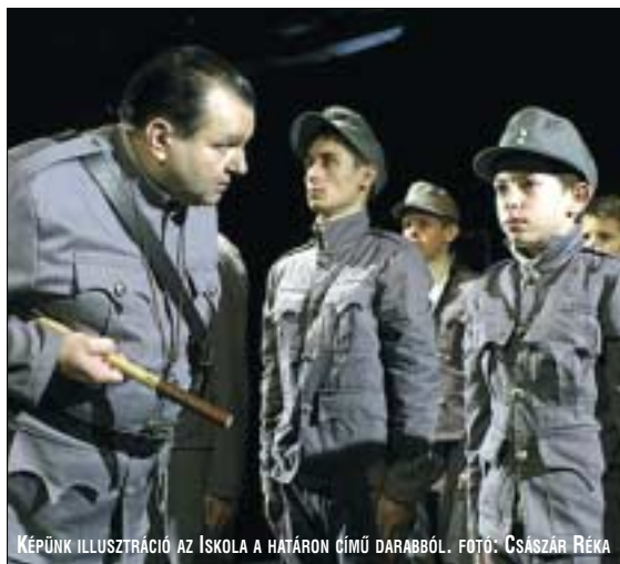
KÉPÜNK ILLUSZTRÁCIÓ AZ ISKOLA A HATÁRON CÍMŰ DARABRÓL.

Mai szemmel nézve azonban a Vihar sokkal inkább a túlélés, a boldogságkeresés szatirikus, tragikomikus drámája. Az orosz kisváros lakói Katyerinán kívül valamilyen megkötik az