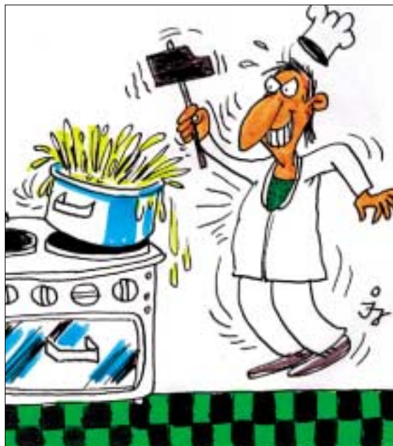
Hagymás törtburgonya aglegény módra

Elkészítés: A kefirt a tojással, cukorral és a búzadarával összekeverem, majd felfőzöm. Amikor tejbegríz állagú, akkor hagyom kicsit kihűlni. Vizes kanalakkal gombócokat formálok belőle és megforgatom a megpirított zsemlemorzsaiban. Az ízeiket fokozni lehet, ha a keverékbe némi vaníliás cukor és mazsola kerül.