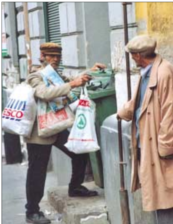
„... a sors, olykor nem tudja mit akar”