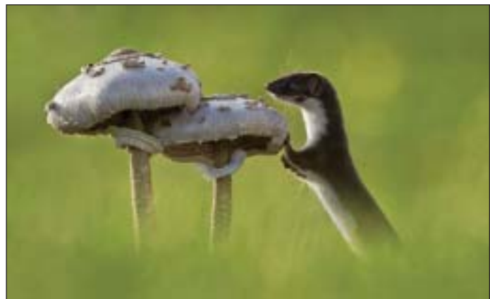
Kiss Ágnes képe a Kézhez szokott vadállatok-sorozatból