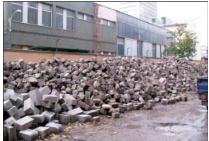
A Batsányi utcában még folynak a munkálatok