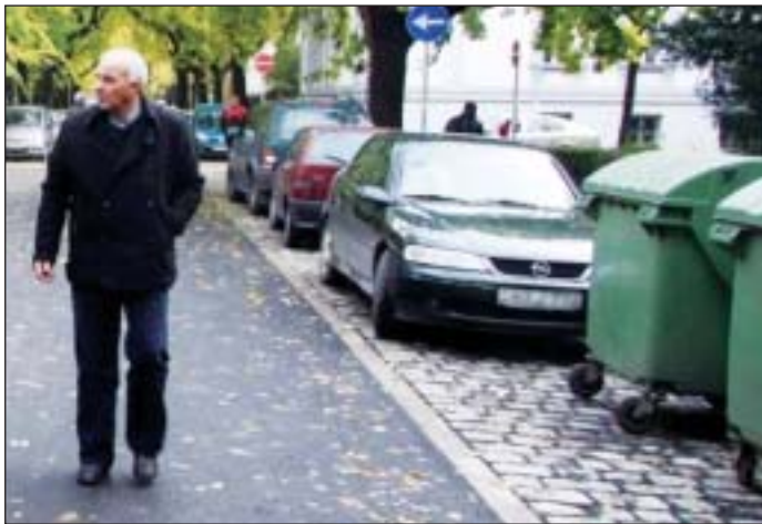
A hivatalos átadás után megindult a forgalom

burkolat épül, s 84 kulturált parkolóhelyet is kialakítanak, amelyekhez - költségkímélő módon felhasználják a felbontott útszakasz nagykockaköveit. Az útépitést egyébként olyan költségvetési forrásból finanszírozzák, amelyet kizárólag földutak szilárd burkolattal történő ellátására lehet felhasználni. (-es)