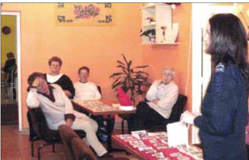
A kép a Köztársaság tér 17. szám alatt készült, a Ciklámen Idősek Klubjában, ahol a kerület többi klubjával együtt, itt is bűnmegelőzési (áldozattá válás elkerülése érdekében gyakoribb bűncselekmények ismertetése: trükkös lopás, zseblöpés, besurranásos lopás, egyéb alkalmi lopások, valamint pénzfelvétel bankautomatából - PIN kód használata stb.) és balaszmegelőzési előadást tartottak.