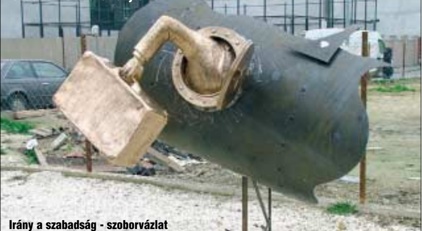
Irány a szabadság - szoborvázlat

jén. A szobor nem csak emlékmű, hanem tájékozódási pont is lesz a majdani dunai tengeralattjáró periszkópjában vetítendő nyolcadik kerületi múltidéző képek és programajánlók révén.