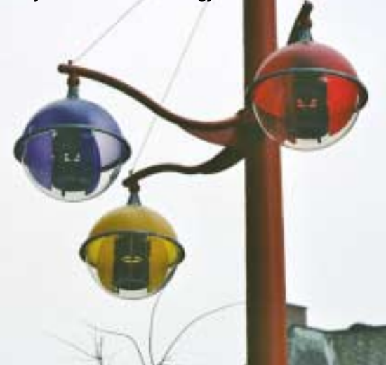
Az ajándék kandelláberek egyike