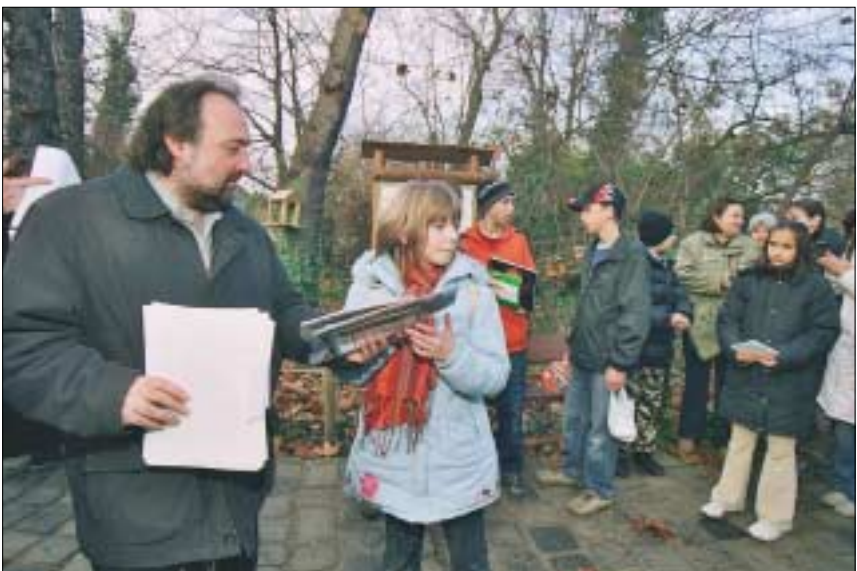
Madáretetőket készítettek a józsefvárosi gyerekek a Fővárosi Állat és Növénykertben

meg a kiállítás idejére kedvenceitől. A Magyar Nemzeti Múzeum Pollack Mihály tervezte épületének 12 éve tartó rekonstrukciója fontos állomásához érkezett. Korszerűsítésének egy szakasza lezárult. Nem csupán a homlokzat, hanem az épületbelső is teljesen megújult. Ezekbe az új terekbe hívják most az idelátogatókat.