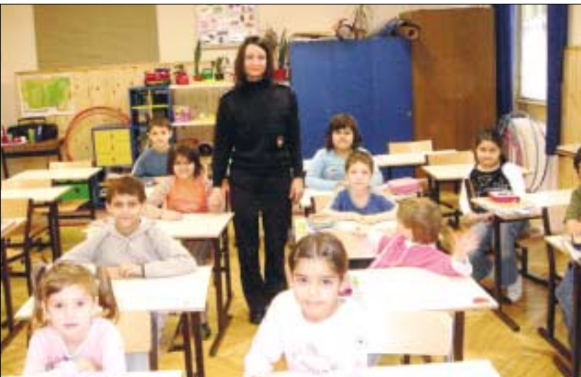
A kép a Práter utcai általános iskolában készült. Az igazgatónő külön kérésére már az első osztályban megkezdte a kerületi rendőrség a prevenció előadásokat.