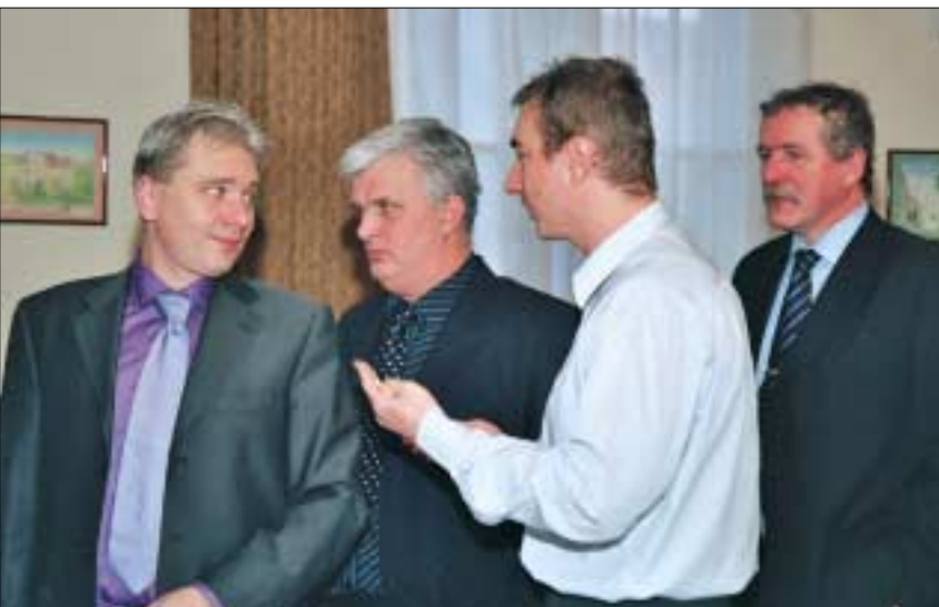
Egyeztetés a testületi ülés szünetében

vezetet. Szintén elfogadták a Józsefvárosi Közbiztonságáért Szolgáltató Kht. 2007. évi előzetes üzleti tervét, és a 2007. évi támogatását.