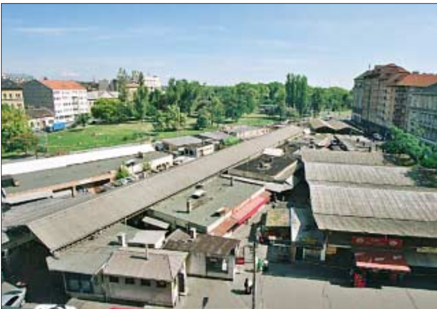
A megörökült Teleki téri piac, amelynek helyén európai színvonalú bevásárló központ épül, megtartva a hely szellemét, piaci jellegét és hagyományait

Sok tapasztalat gyűlt már össze a különböző önkormányzatoknál piacépítésekkel kapcsolatban. Volt köztük pár sikertörténet, de volt éppen elég, amely kudarcba fulladt. Nem akarunk olyan helyzetbe kerülni, hogy a jó cél belefüljön egy rossz megvalósításba: sem az árusokat nem hozhatjuk méltatlan helyzetbe, sem a környék lakosságától nem vehetjük el az olcsó és jó minőségű portékákat. Ugyanakkor a tér állapotait rendeznünk kell. Így tehát egy keskeny ösvényen kell megtalálnunk az utat, szükségünk van „piacügyekben” jártas szakértők bevonására.